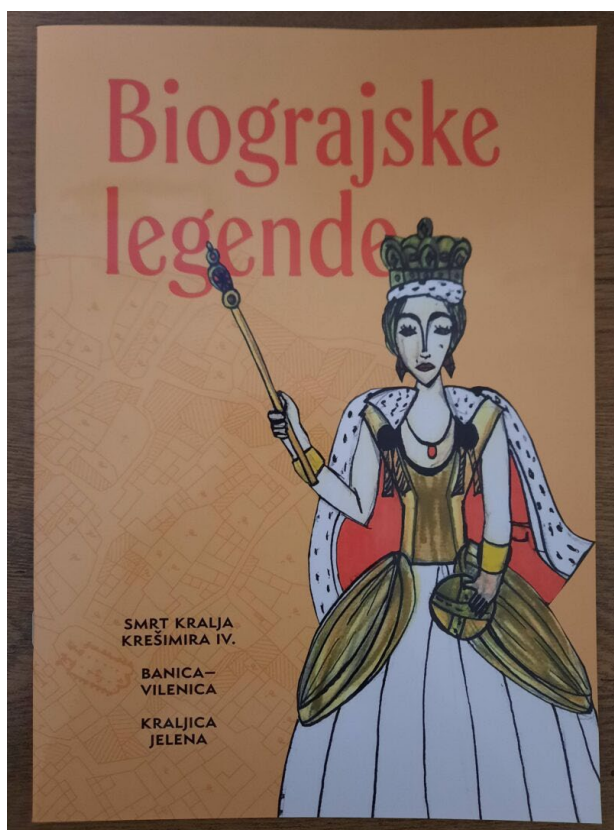
*brošura/slikovnica 'Biograjske legende'